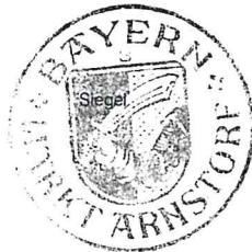
Christoph Brunner Erster Bürgermeister

Aushang am: 16.03.2022 Abgenommen am: 01.04.2022