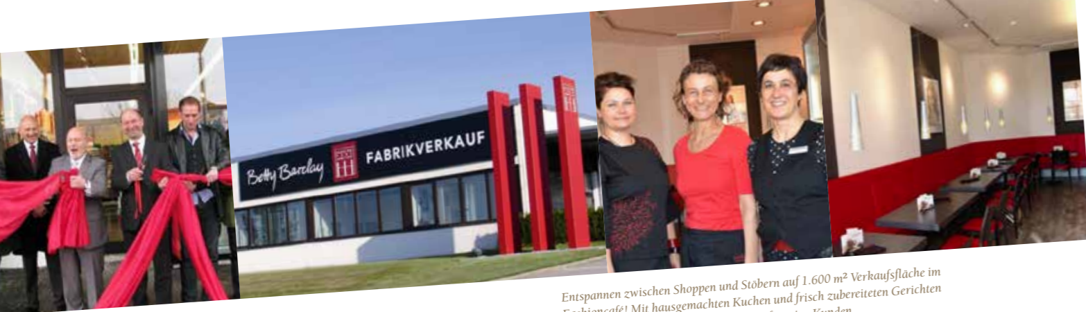
Entspannen zwischen Shoppen und Stöbern auf 1.600 m 2 Verkaufsfläche im Fashioncafé! Mit hausgemachten Kuchen und frisch zubereiteten Gerichten verwöhnt das Team des Fashion Park Cafés seine Kunden. WWW.FASHIONPARK.DE