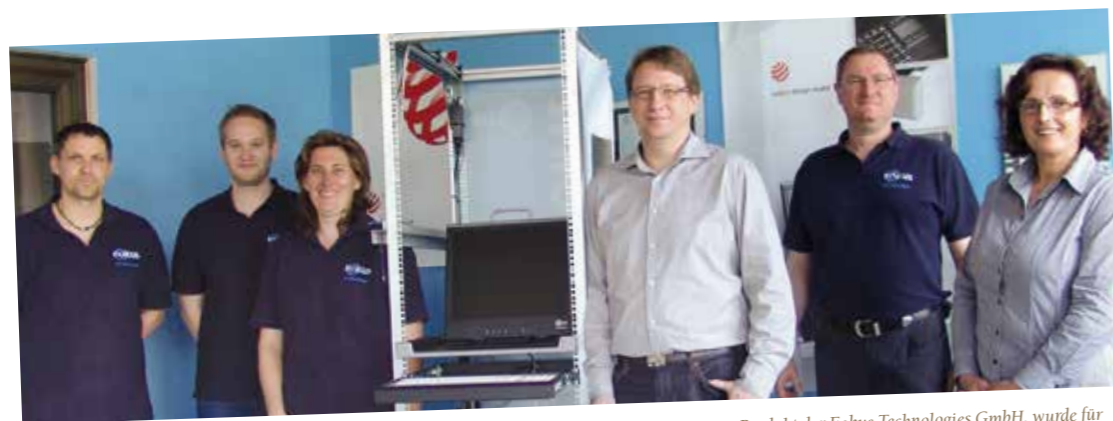
Die TFT-Konsole RM 17, ein Produkt der Fokus Technologies GmbH, wurde für herausragende Designqualität mit dem Red Dot Design Award, einem weltweit anerkannten Qualitätssiegel, verliehen vom Design Zentrum Nordrhein Westfalen, ausgezeichnet.