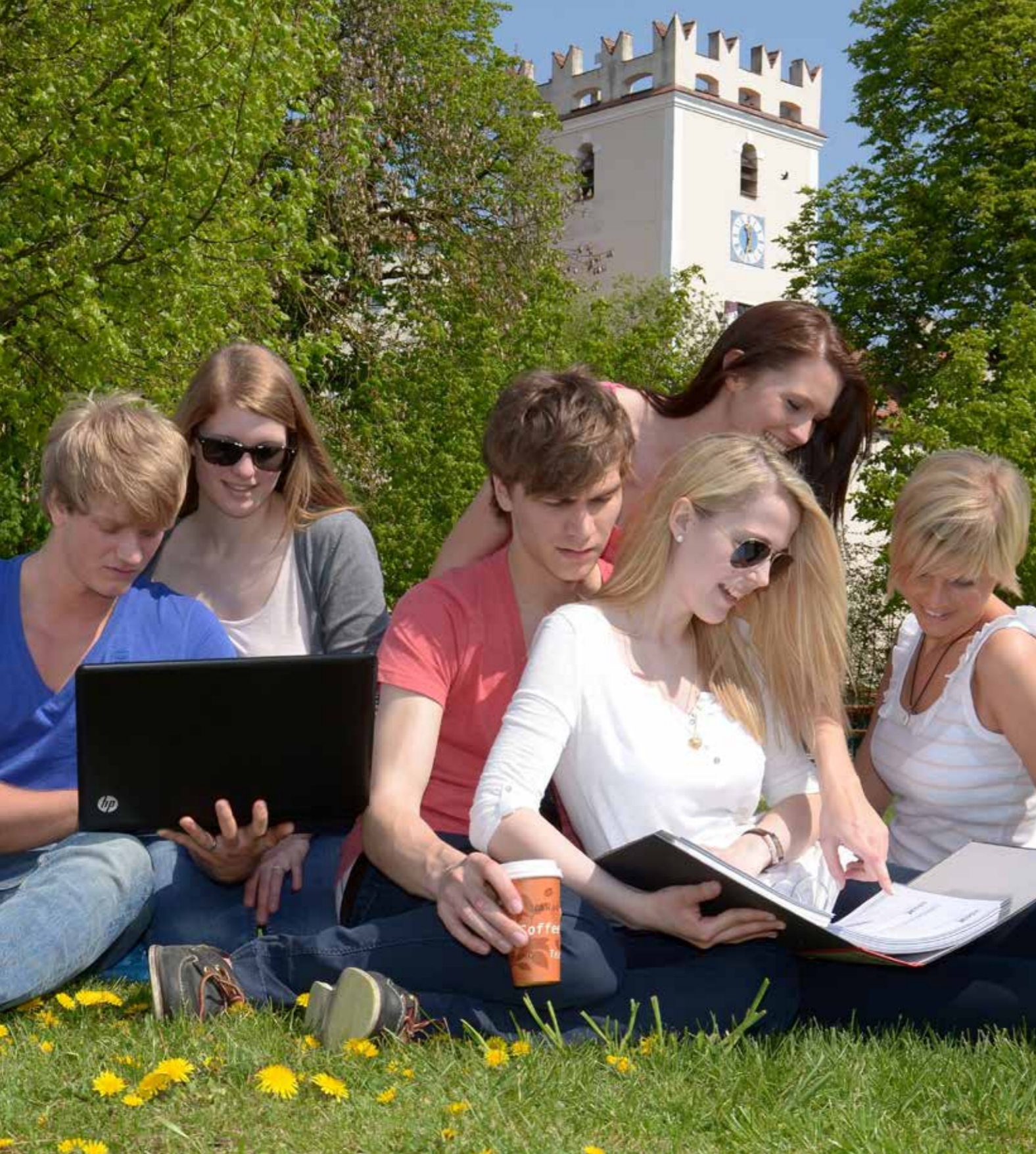
Campus Schloss Mariakirchen