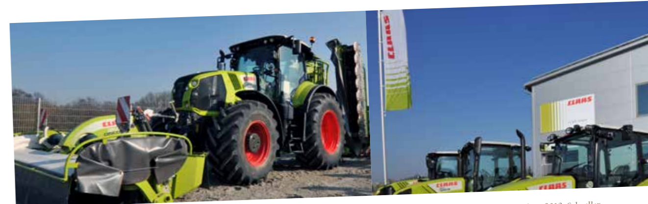
CLAAS Südostbayern GmbH, Niederlassung in Arnstorf seit 2013. Schneller Service vor Ort – modernste Technik und höchste Ersatzteilsicherheit. WWW.SUEDOSTBAYERN.CLAAS-PARTNER.DE