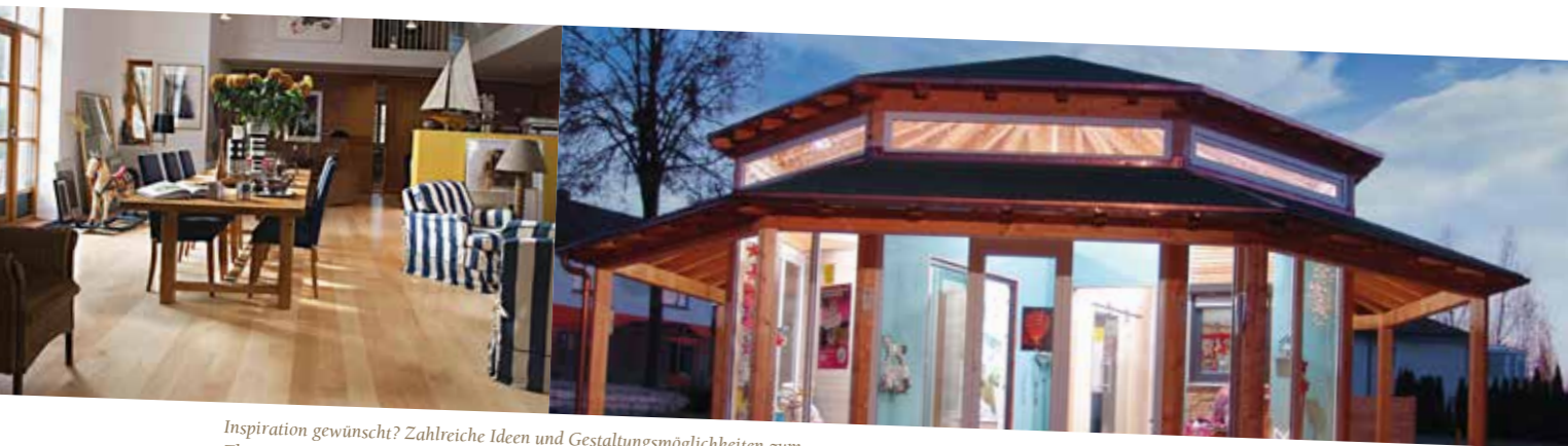
Inspiration gewünscht? Zahlreiche Ideen und Gestaltungsmöglichkeiten zum Thema „Innenausbau mit Holz“ zeigt das Unternehmen Büchner auf einer Fläche von über 1.000m 2 in seinem Ausstellungspavillon in Arnstorf. WWW.HOLZ-BUECHNER.DE