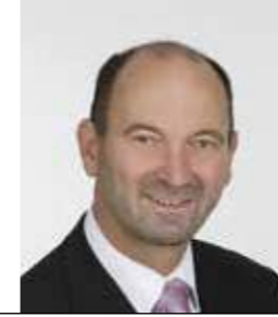
ERSTER BÜRGERMEISTER ALFONS SITTINGER