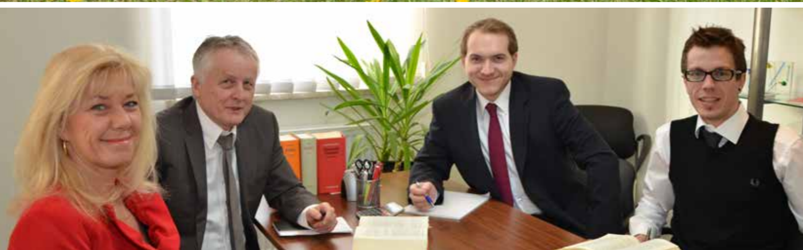
Rechtsanwalts- und Steuerberatungskanzlei Tischler & Wolfrum